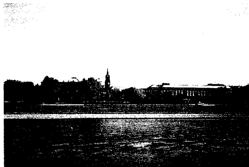
Blick vom Denkmal zum rechten Elbufer.

Am 10. November 1996 fand dann in Dresden nach einem Gedenkgottesdienst in der russisch-orthodoxen Kirche zum Heiligen Simeon vom wunderbaren Berge nach einer wissenschaftlichen Tagung über »Das Prophetische in Dostojewskis Dämonen« eine symbolische Grundsteinlegung für ein derartiges Denkmal statt. Aus der Sicht Rukawischnikows wird der Dichter als Denker gestaltet: sitzend, gebeugt, in sich versunken, grübelnd – ein Philosoph. Die nun enthüllte Dresdner Variante ist keine Kopie, sondern eine neue; wie mir persönlich scheint, glücklicher gestaltet als die Moskauer Erstfassung und auch an einem besseren Ort als dort platziert.