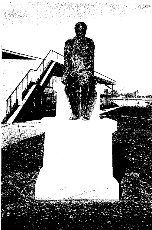
Das Denkmal für Fjodor Michailowitsch Dostojewski am linken Elbufer in der Nähe des Hotels Maritim (Erlwein-Speicher) und dem Internationalen Congress Center (ICC).

Das im Mai 1993 gegründete Deutsch-Russische Kulturinstitut e. V. in Dresden war seit 1995 bemüht, an Dostojewskis Aufenthalte in der Stadt in den verschiedensten Veranstaltungen, in Vorträgen und Publikationen zu erin-