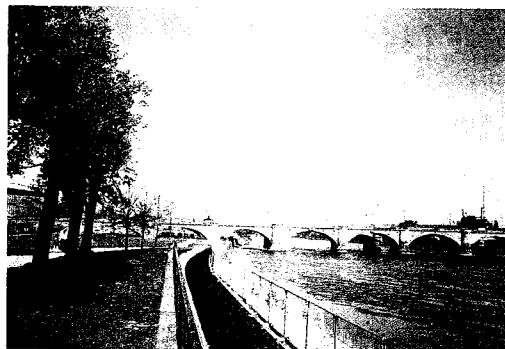
Abb. rechts: Blick vom Denkmal auf die Marienbrücke.

Dialogs aber ehrten sie durch ihre aktive Teilnahme die Denkmalsweihe.