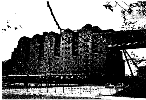
Blick vom Denkmal auf den zum Hotel Maritim umgebauten Erlwein-Speicher und auf den Neubau des ICC.